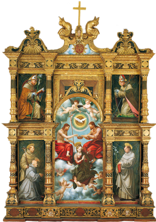
Maître du Politico du Couronnement, Politico, détrempe sur tableau central transporté sur toile), première moitié du XVIème siècle, de l'Antique Eglise de Saint Francesco de Biella

Le Musée du Territoire Biellais a été inauguré en 2001 dans les locaux restaurés du XVIème siècle couvent de Saint Sébastien.