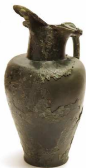
Schnabelkanne, lamina bronzea, 45 a. C.

L'habitation de la Burcina illustre la vie quotidienne pendant la période de Fer, à ce moment depuis une tombe d'un personnage éminent de l'élite guerrière celtique, retrouvé dans le même site, découle une cruche à bec (schnabelkanne) en lame de bronze de production étrusque.